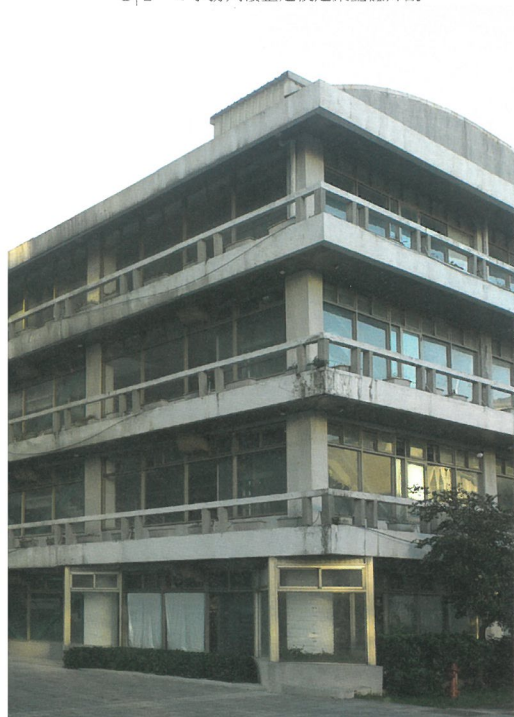
1 | 2 2 學務大樓整建後建築整體外觀