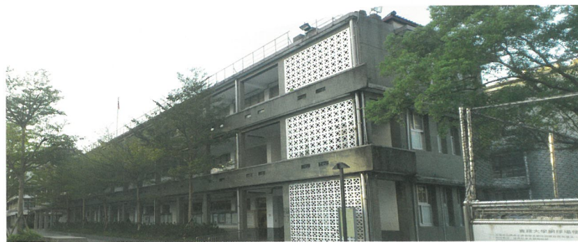
1 教學大樓整建後建築整體外觀 2 教學大樓整建前外觀

然而，由實踐大學建築系教授帶領的團隊卻能夠看到這兩棟大樓的歷史價值，認為這兩棟珍貴的老建築一旦拆掉就蓋不回来了，因此向校方積極遊說，希望能夠用整建維護的方式讓這兩棟老建築再生，繼續作為教育現場服務實踐大學的師生。在校方同意後，團隊採取了幾項創新的設計，既保留了老建築本身的特色，又在功能上、景觀上面賦予其新的生命，更是對全校師生做最好的建築物的整建維護示範。