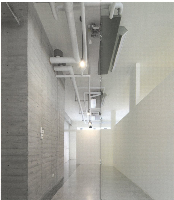
1|2 1 學務大樓建築結構與鋁窗、遮陽柱構造關係 2 導入採光的學務大樓樓梯間 3|4 3 教學大樓的鑄造鋁製漏窗 4 學務大樓的室內空間

首先，在必要的建築結構補強上，團隊並未採用一般增加大柱子的補強方式，分別運用設置剪力牆與微型樁基礎方式，以及設置十字型的內部局擴柱及翼牆、剪力牆等方式進行補強。接著，以具有切削變化的柱列系統，兼顧採光與視覺的通透感，重新創造具有一致性且能夠呼應其他校園內建築的建築立面風貌。其中，作為創校第一棟建築的教學大樓，在建材上更是大量採用了傳統的斬石子工法，並將立面原有的水泥花窗轉變為鑄造的鋁製漏窗外牆，再現五、六〇年代建築獨特的外觀與紋理，使得整建後的建築遠看新穎，近看時又感受的到舊建築時代的視覺元素，台北老屋新生委員王俊雄特別談到，民生學院在建築的語彙、復舊與創新上，有具突破性的表現，讓這棟建築不僅是持續承載著淵遠流長的故事，更在建築本質上追求卓越。